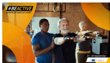
#Sports clubs and fitness centres